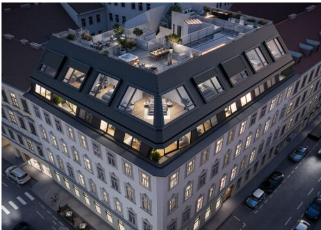
Essenz No. 1 | Fassade Oben