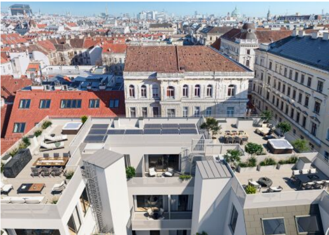
Essenz No. 1 | Fassade Oben