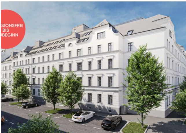
Rosegggasse | Fassade Tag