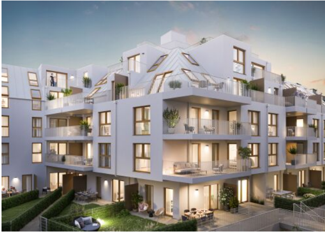
Schumannngasse | Fassade Nord Abend