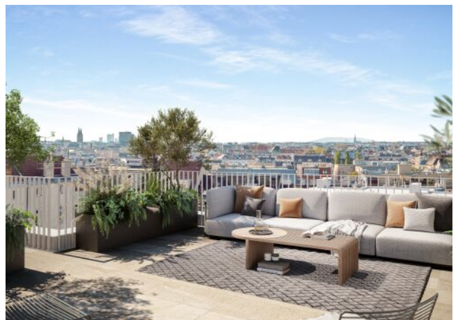
Schumannngasse | Dachterrasse