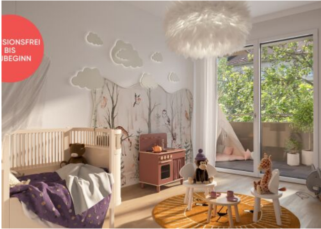
TRAISENGASSE | Kinderzimmer