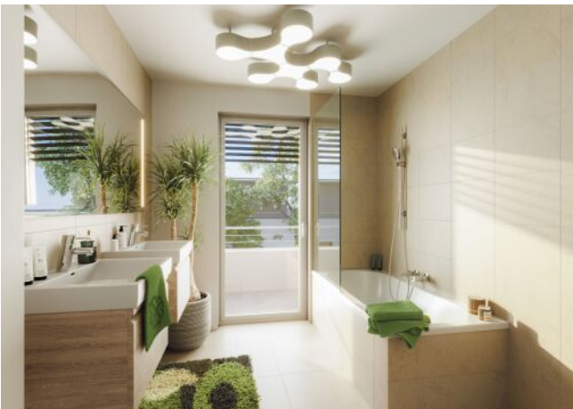
Bella Vita | Badezimmer