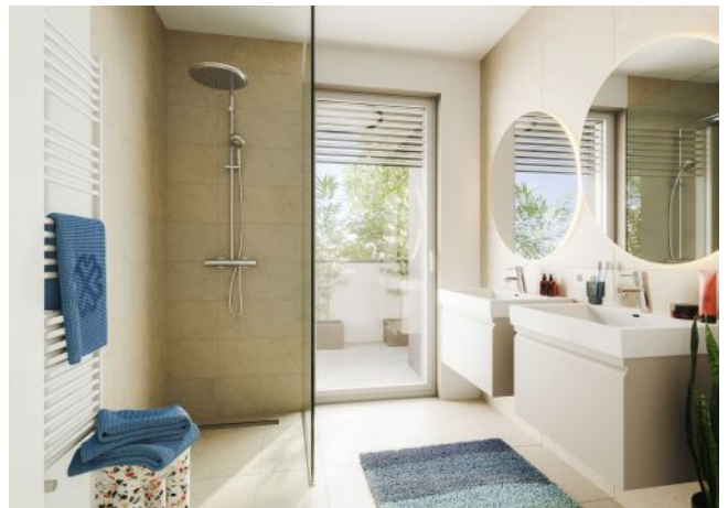
Bella Vita | Badezimmer