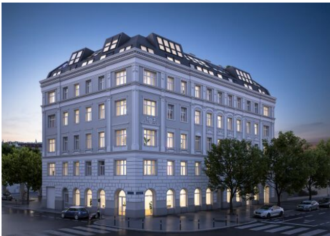
The Legacy | Fassade