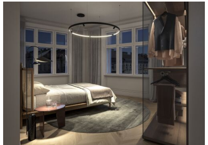
The Legacy | Schlafzimmer Regelgeschoss