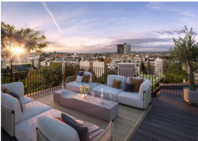
The Legacy | Dachterrasse