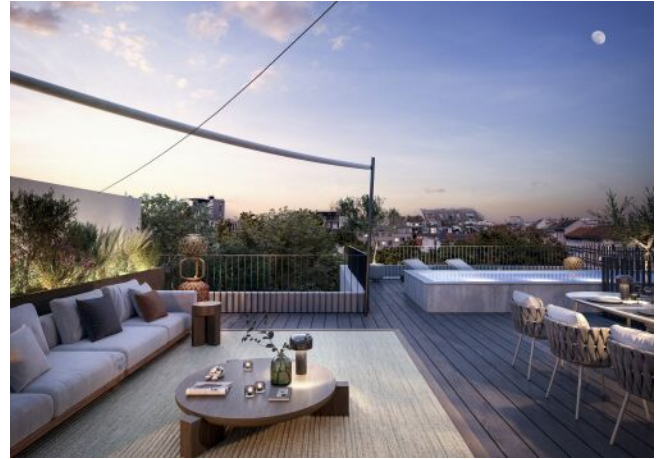
The Legacy | Dachterrasse