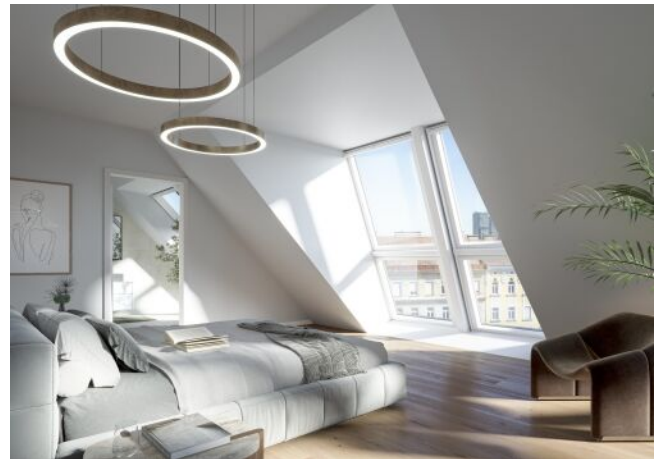
The Legacy | Schlafzimmer Dachgeschoss