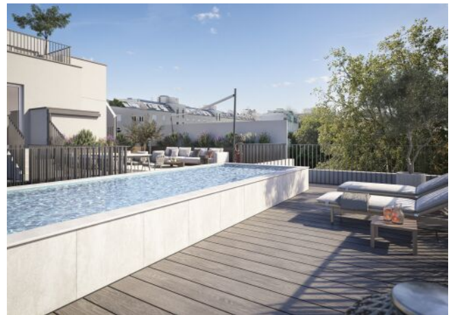
The Legacy | Dachterrasse Pool