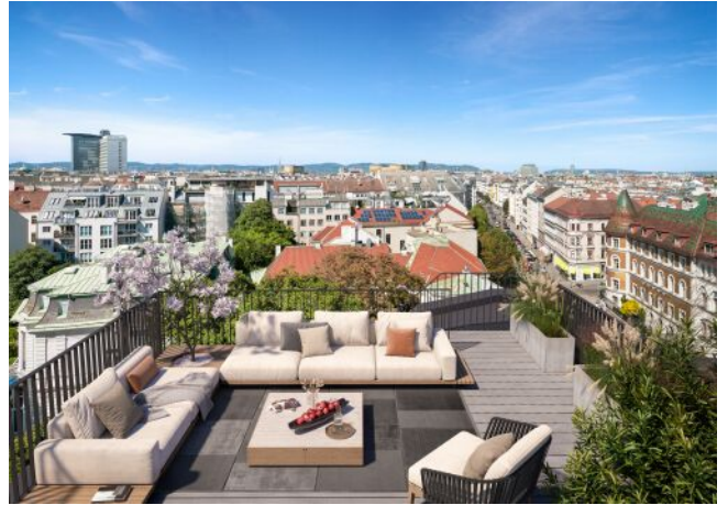
The Legacy | Dachterrasse