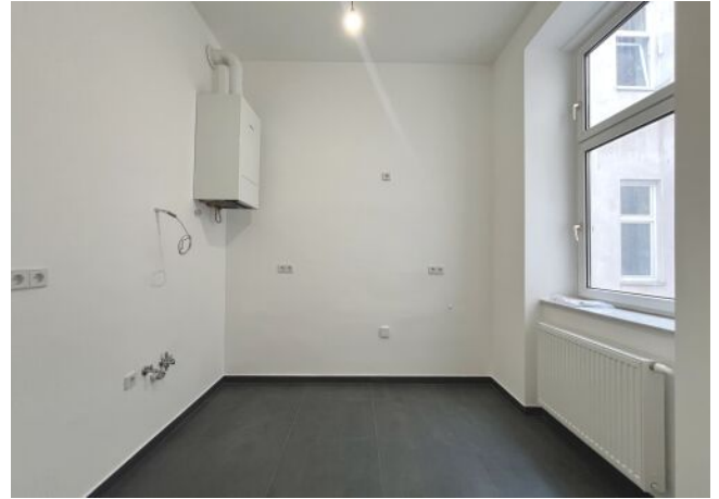
Küche inkl. Anschlüsse