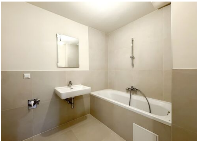
Schäffergasse 18-20 | Top 1.06