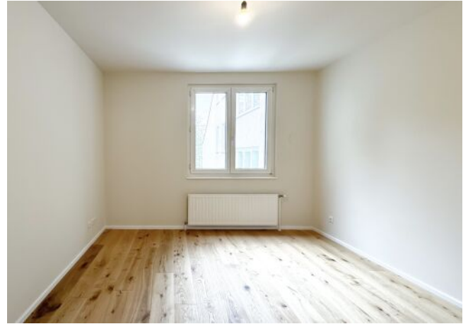
Schäffergasse 18-20 | Top 1.06