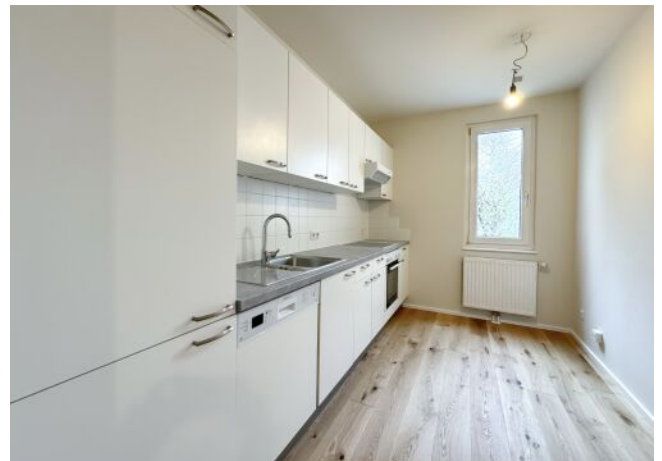
Schäffergasse 18-20 | Top 1.06