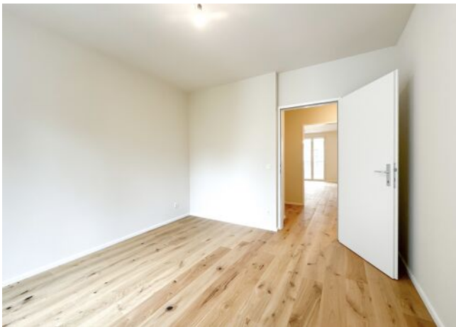
Schäffergasse 18-20 | Top 1.06