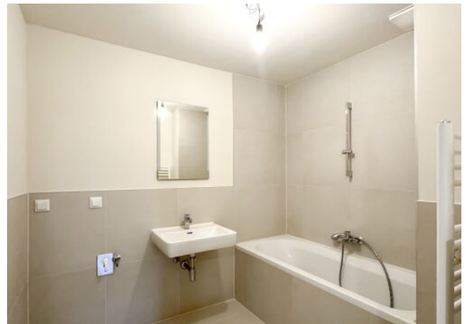
Schäffergasse 18-20 | Top 1.06