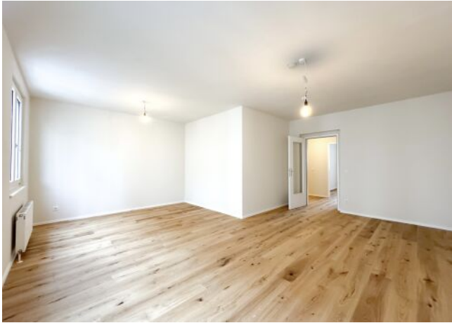
Schäffergasse 18-20 | Top 1.06