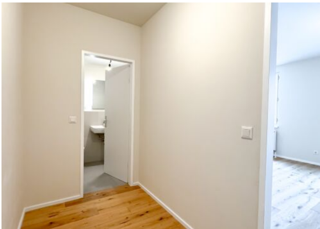
Schäffergasse 18-20 | Top 23