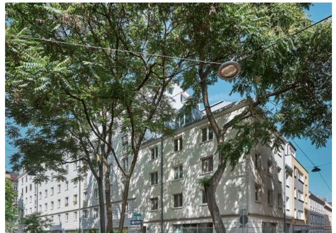
Schäffergasse 18-20 | Fassade