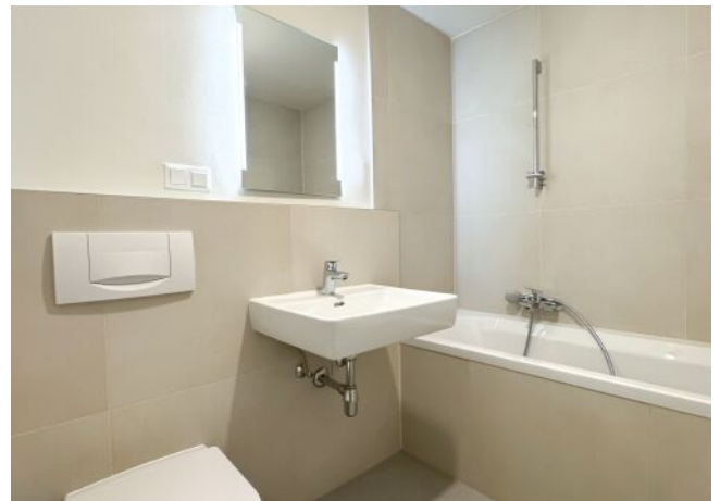
Schäffergasse 18-20 | Top 23