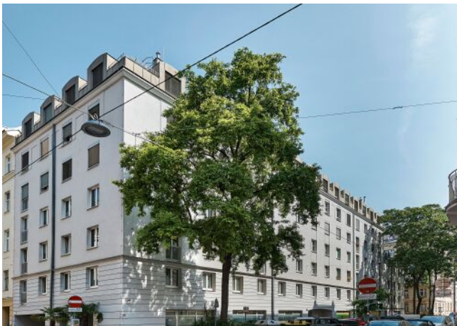
Schäffergasse 18-20 | Fassade