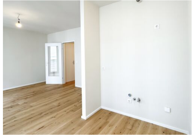
Schäffergasse 18-20 | Top 23