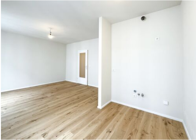
Schäffergasse 18-20 | Top 23