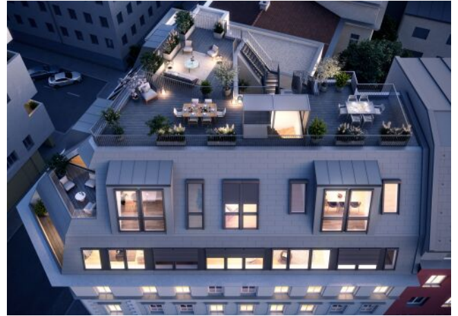
Vivienne | Fassade Nacht