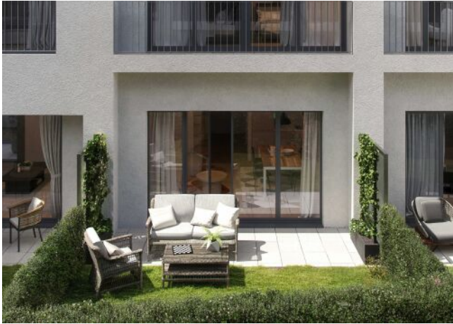
Wiedner Hauptstrasse 140 | Garten