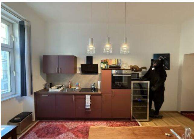
Küche + Essbereich