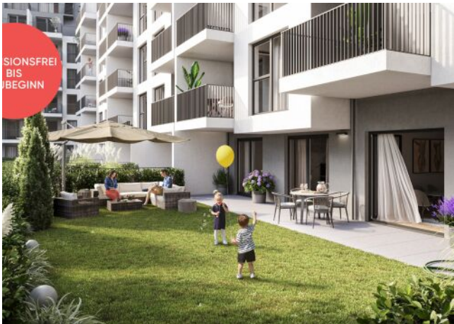
Rosegggasse | Gartenwohnung