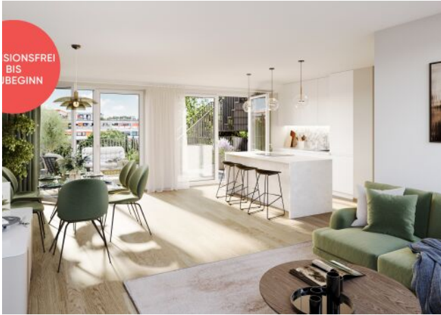
Roseggergasse | Wohnraum