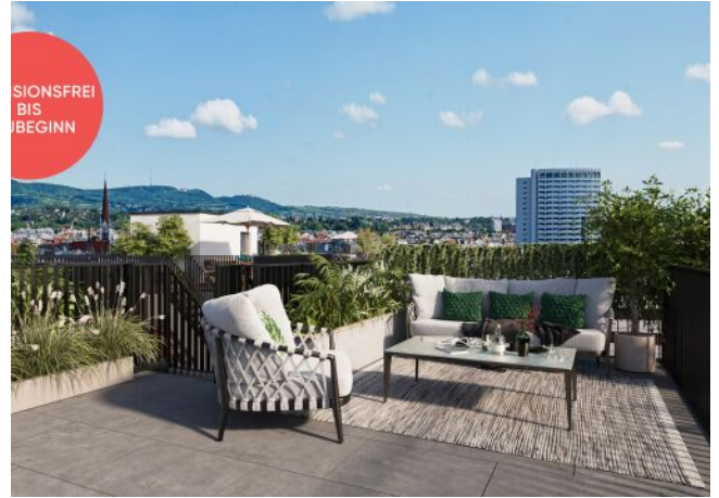
Roseggergasse | Dachterrasse