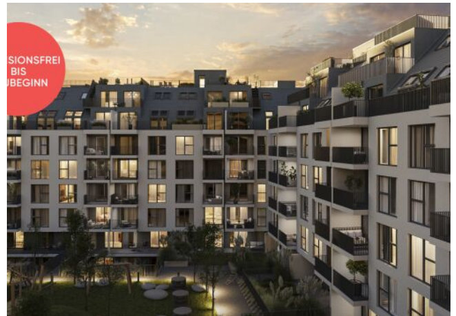
Rosegggasse | Fassade Abend