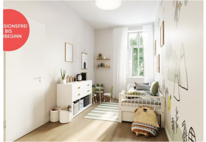
Rosegggasse | Kinderzimmer