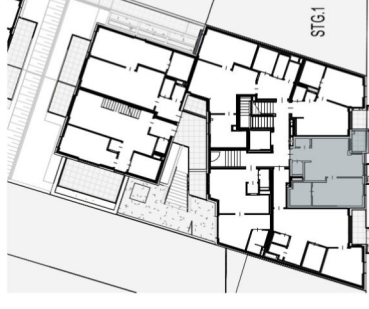
Ottakringer Straße 26