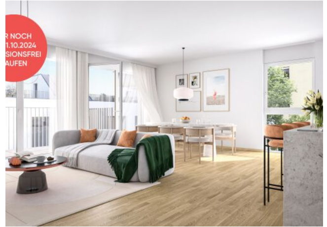
Ottakringer Straße 26 | Wohnzimmer