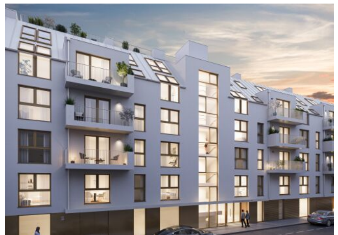
Schumannngasse | Fassade