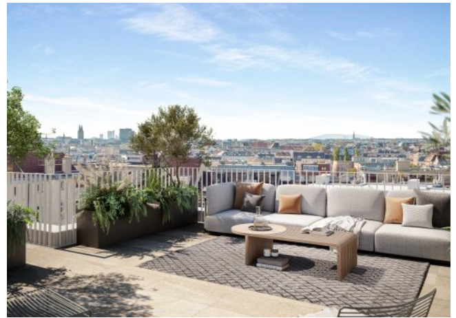
Schumannngasse | Dachterrasse