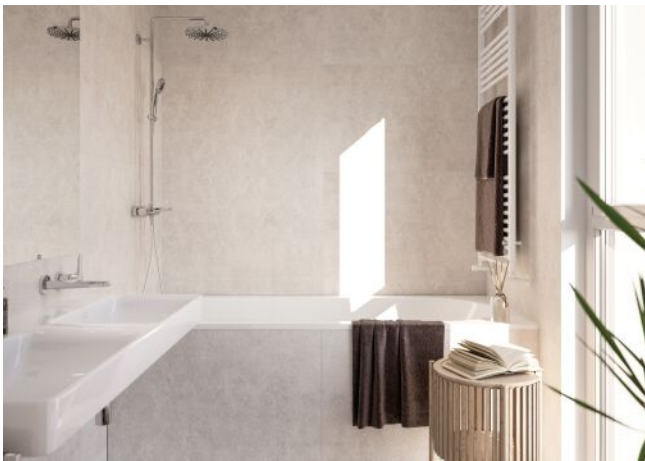
Schumannngasse | Badezimmer