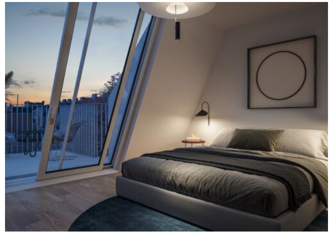
Schumannngasse | Schlafzimmer