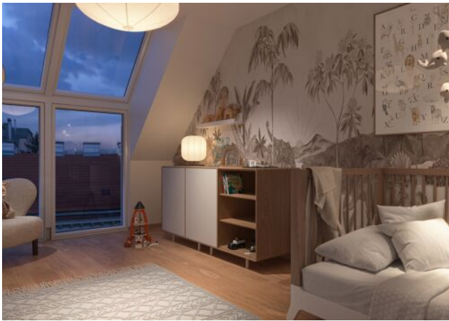
Schumannngasse | Kinderzimmer