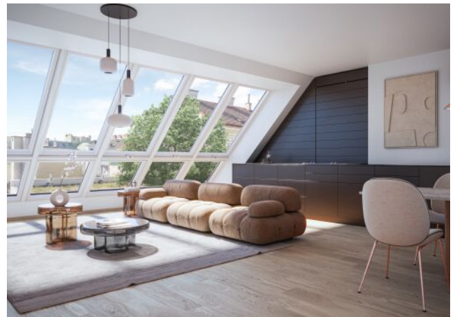
Schumannngasse | Wohnraum