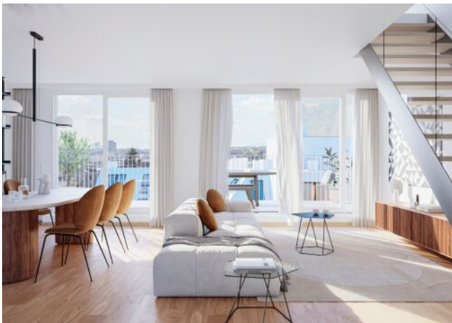
Schumannngasse | Wohnraum