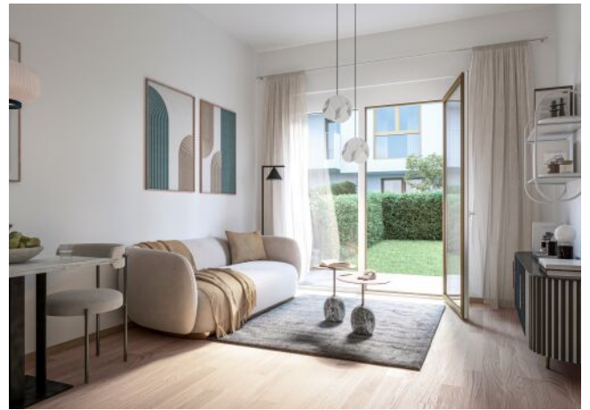
Schumannngasse | Wohnraum