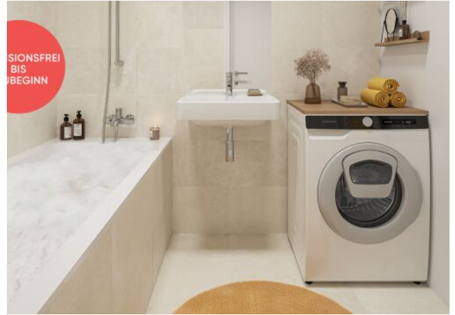
TRAISENGASSE | Badezimmer