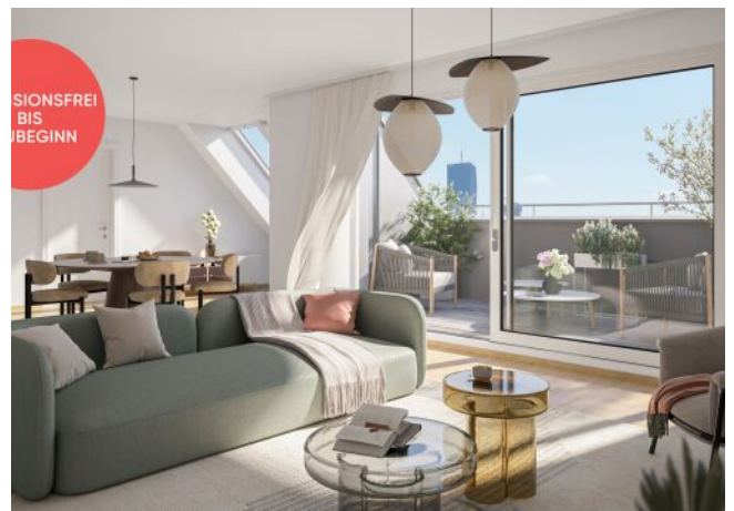
TRAISENGASSE | Eigentum mit Donaublick