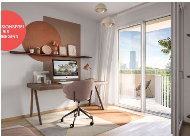
TRAISENGASSE | Home Office