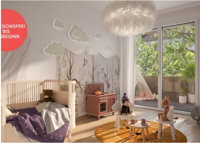
TRAISENGASSE | Kinderzimmer