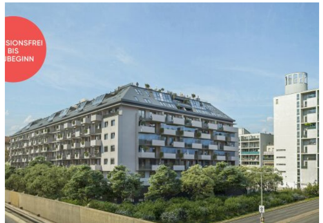
Traisengasse | Eigentum mit Donaublick