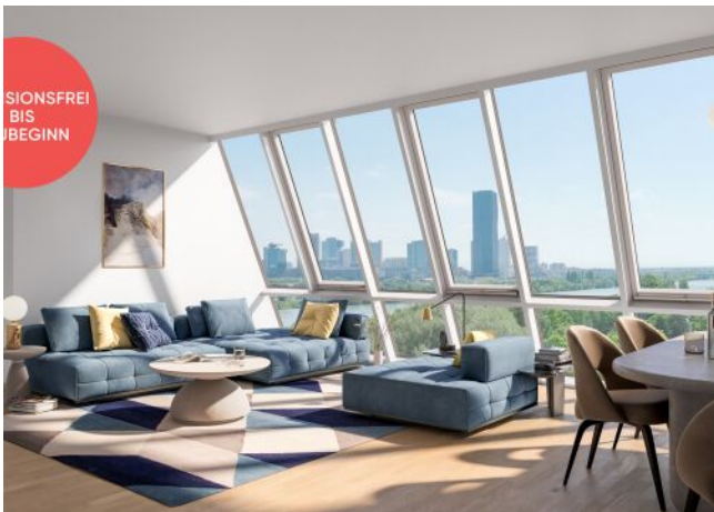
TRAISENGASSE | Penthouse Donaublick