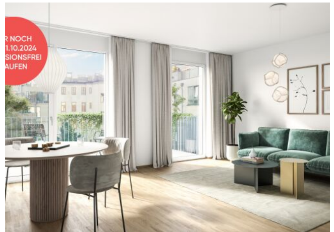
Fahrbachgasse 6-8 | Wohnraum