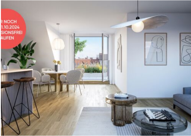
Fahrbachgasse 6-8 | Wohnraum