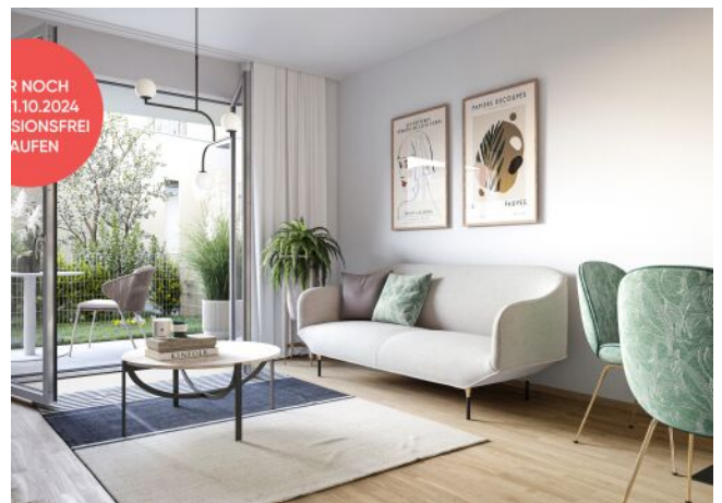
Fahrbachgasse 6-8 | Wohnraum