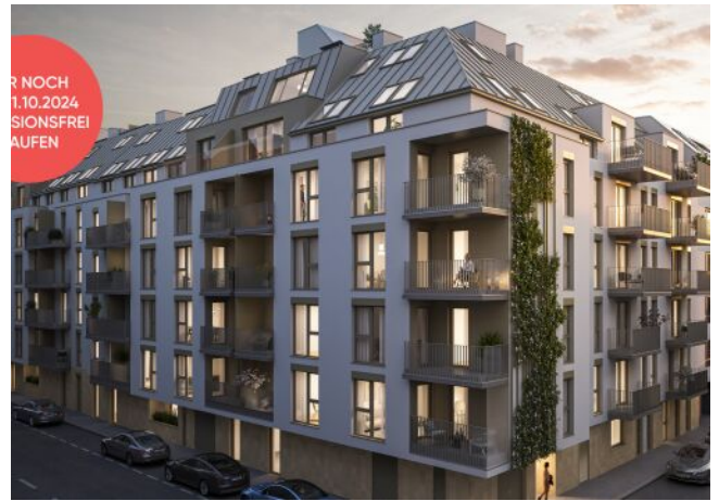
Fahrbachgasse 6-8 | Fassade