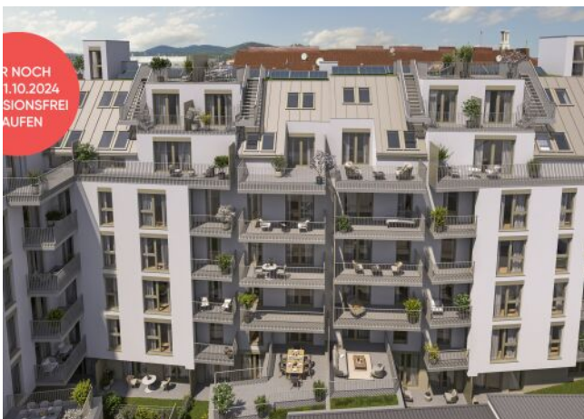
Fahrbachgasse 6-8 | Hofansicht