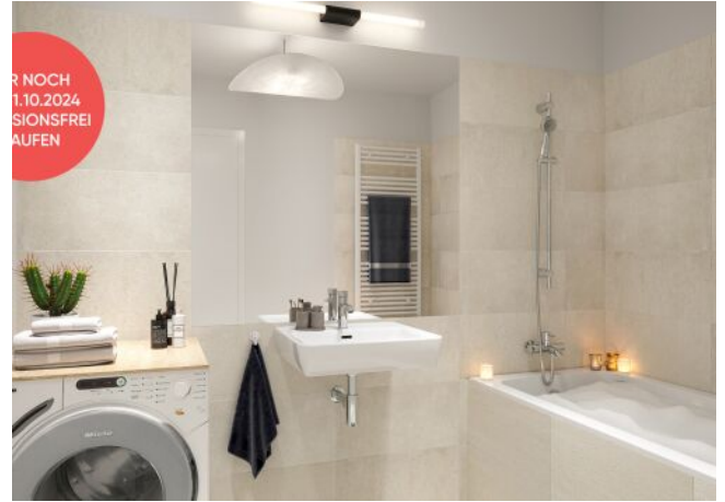
Fahrbachgasse 6-8 | Bad