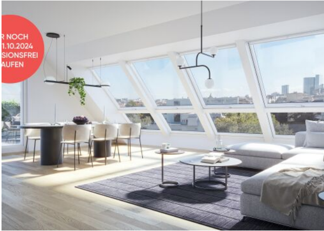
Arndtstraße 50 | Wohnraum