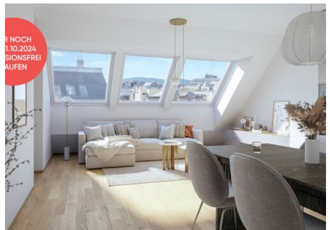
Arndtstraße 50 | Wohnraum