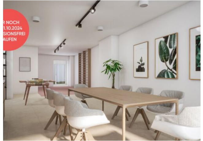
Arndtstraße 50 | Gemeinschaftsraum