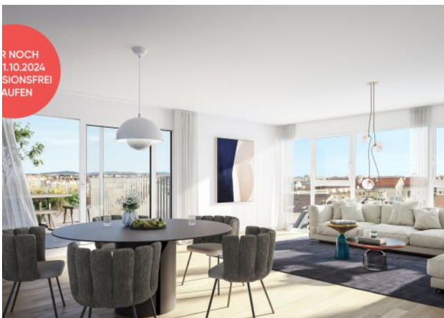
Arndtstraße 50 | Wohnraum