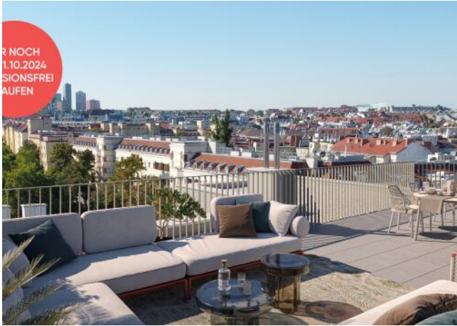
Arndtstraße 50 | Dachterrasse