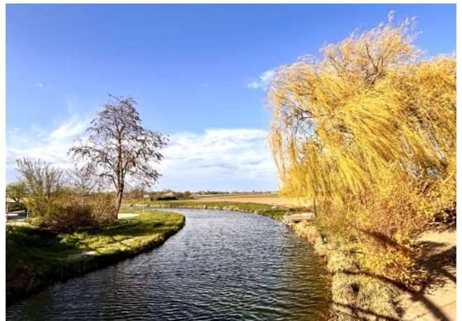
Bella Vita | Wiener Neustädter Kanal