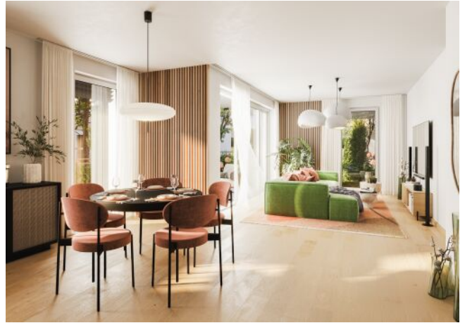
Bella Vita | Wohnraum