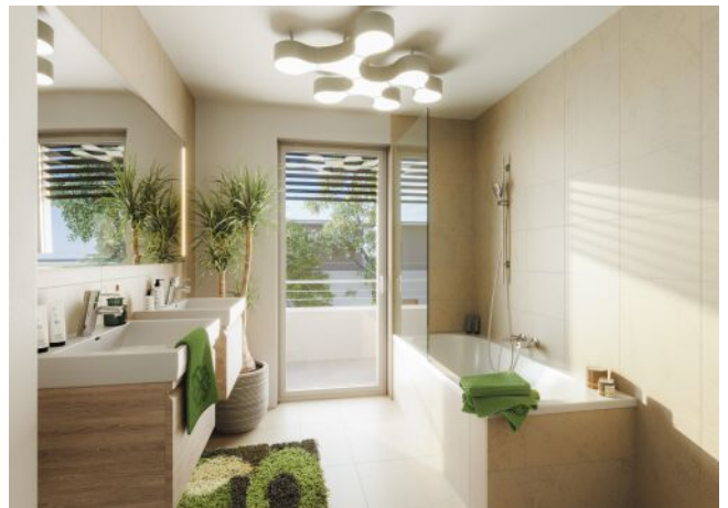
Bella Vita | Badezimmer