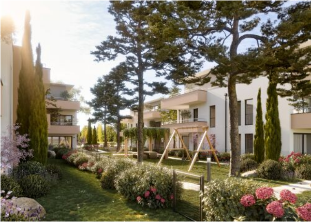
Bella Vita | Garten