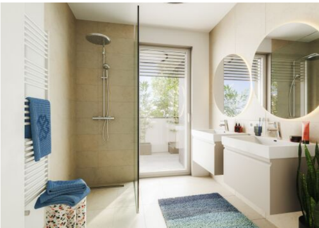
Bella Vita | Badezimmer