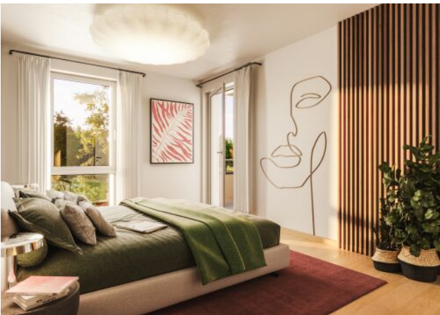
Bella Vita | Schlafzimmer