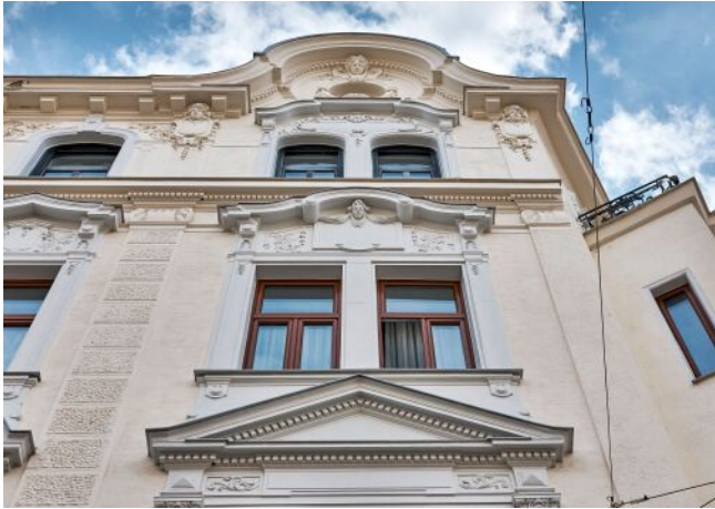
Bergsteiggasse 26A | Fassade