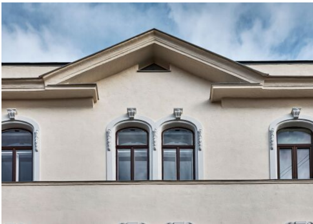
Bergsteiggasse 26A | Fassade