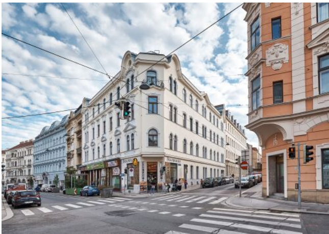
Bergsteiggasse 26A | Hausansicht