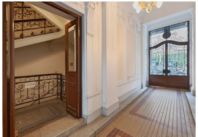
Bergsteiggasse 26A | Hauseingang