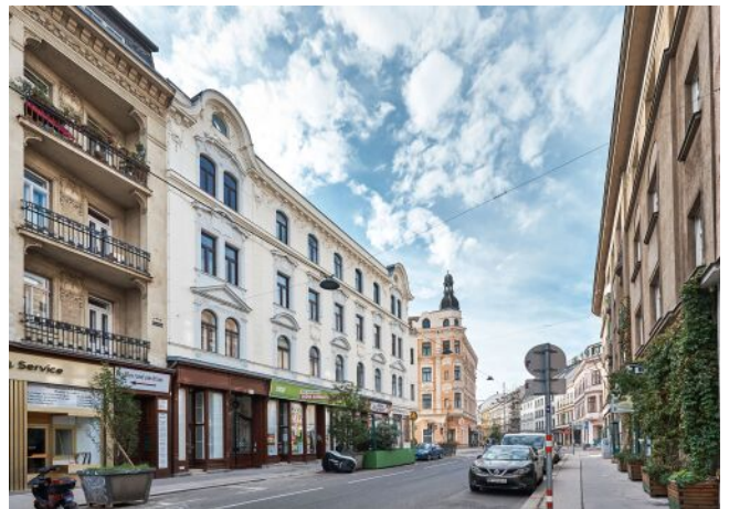
Bergsteiggasse 26A | Hausansicht