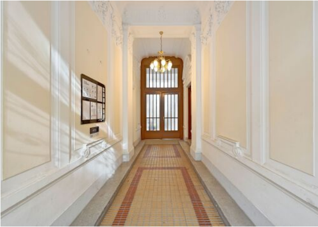
Bergsteiggasse 26A | Hauseingang