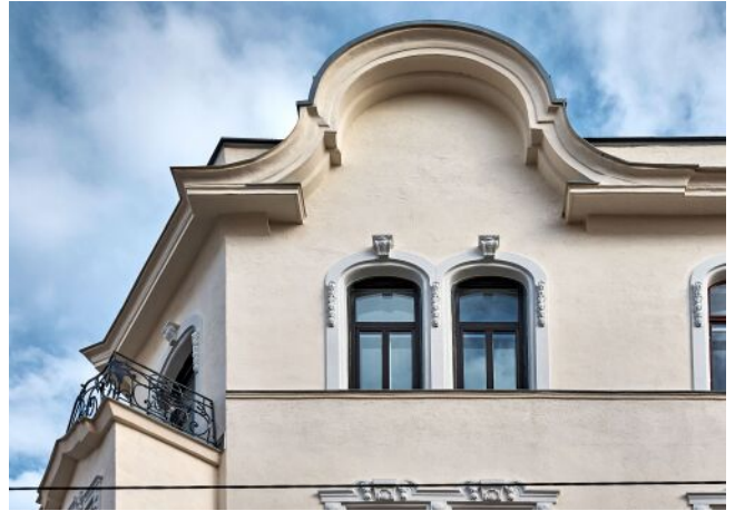
Bergsteiggasse 26A | Fassade