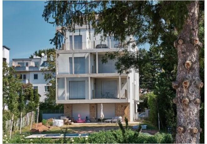
Greenhill Suites | Grünruhelage