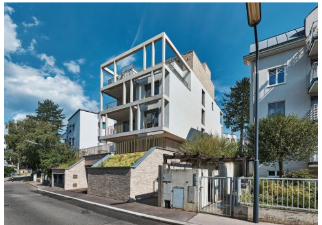
Greenhill Suites | Fassade