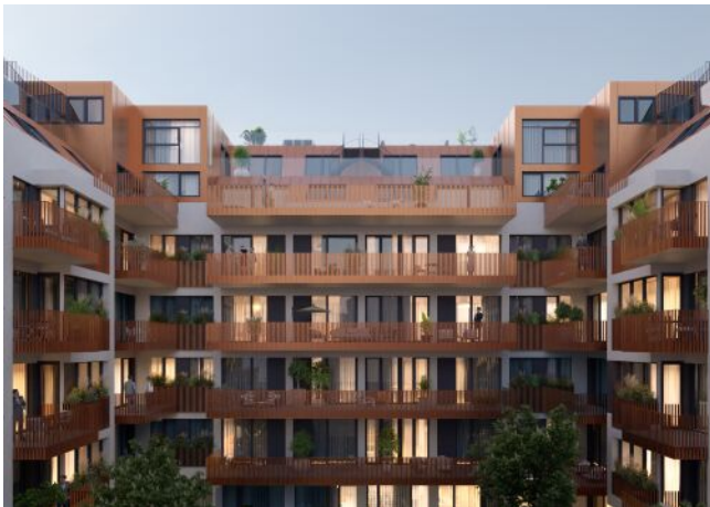
Herbststraße 6-10 | Hof