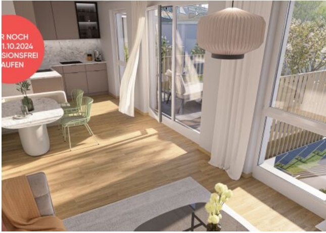
Ottakringer Straße 26 | Wohnraum