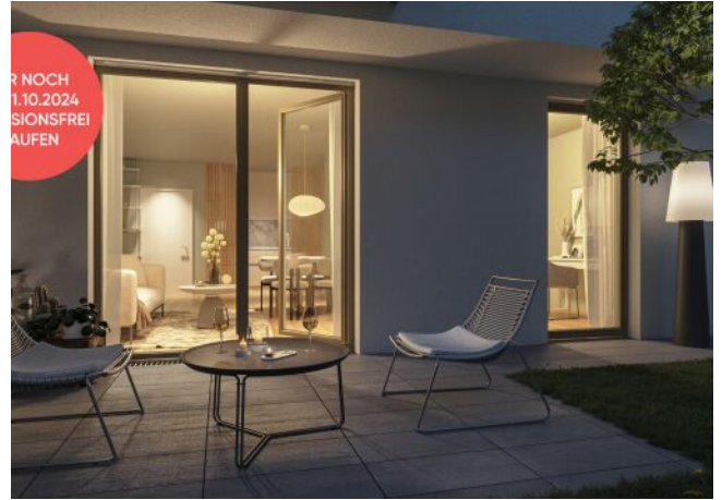
Ottakringer Straße 26 | Gartenwohnung