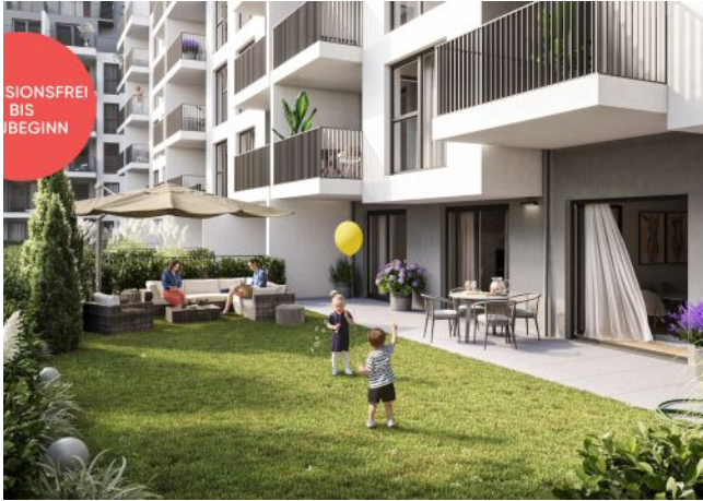
Roseggergasse | Gartenwohnung