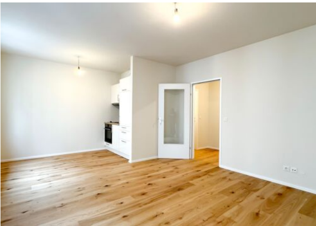
Schäffergasse 18-20 | Wohnraum