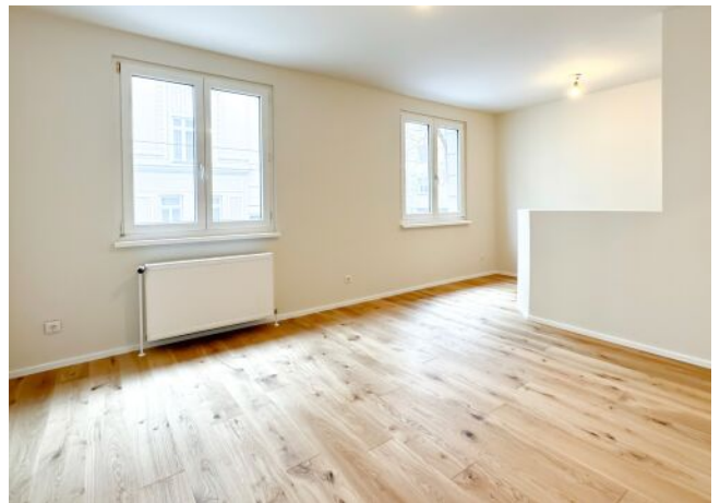
Schäffergasse 18-20 | Wohnraum