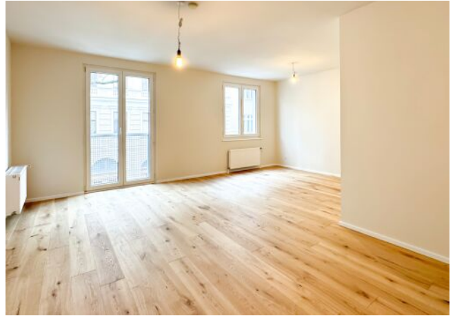
Schäffergasse 18-20 | Wohnraum