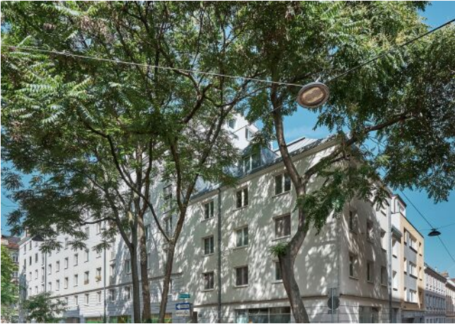
Schäffergasse 18-20 | Fassade