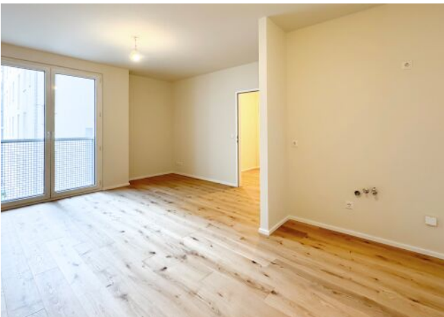
Schäffergasse 18-20 | Wohnraum