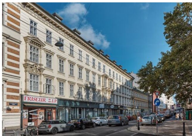
Schönbrunner Straße 20-24 | Fassade