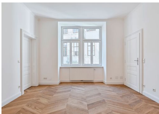
Schönbrunner Straße 20-24 | Wohnraum