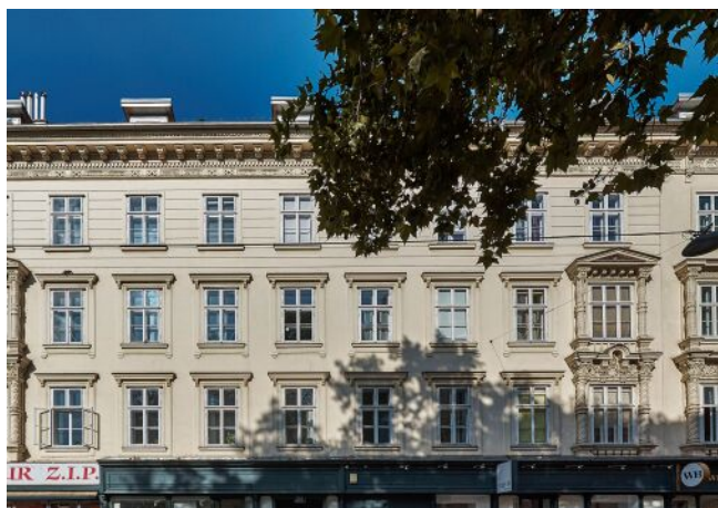
Schönbrunner Straße 20-24 | Fassade