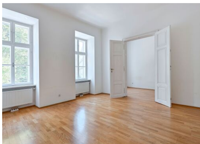
Schönbrunner Straße 20-24 | Wohnraum