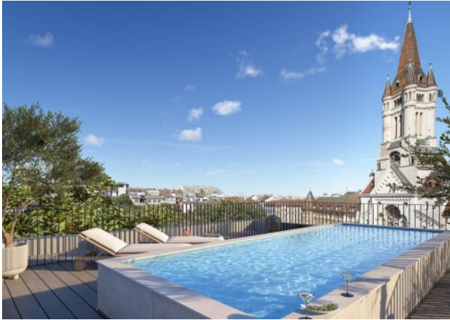
The Legacy | Dachterrasse Pool