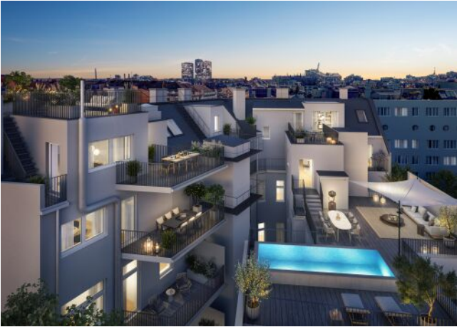
The Legacy | Hof