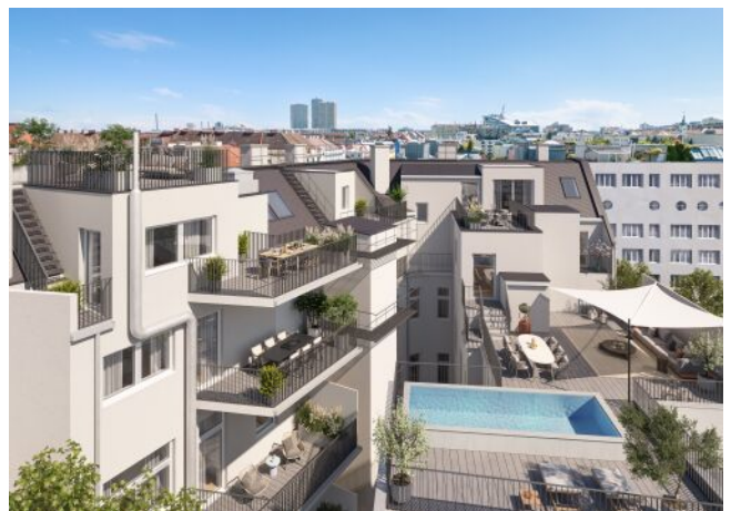
The Legacy | Hof