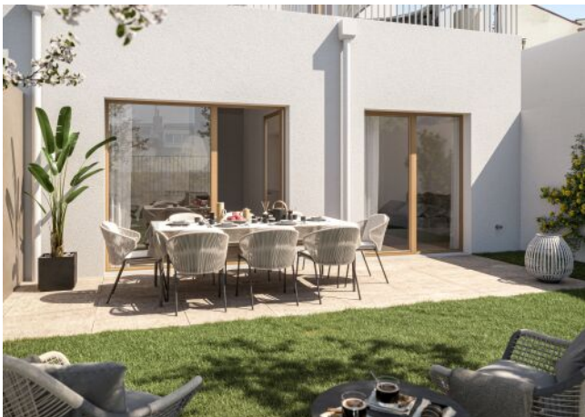
Schumannngasse | Garten