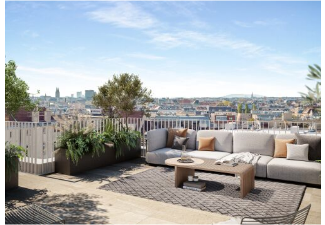
Schumannngasse | Dachterrasse