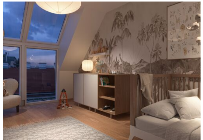
Schumannngasse | Kinderzimmer