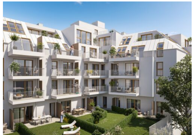
Schumannngasse | Fassade