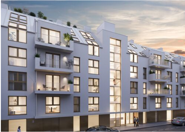
Schumannngasse | Fassade