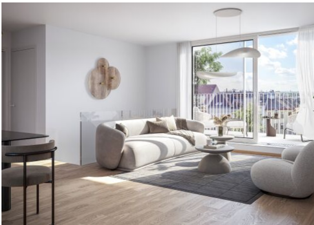
Schumannngasse | Wohnraum