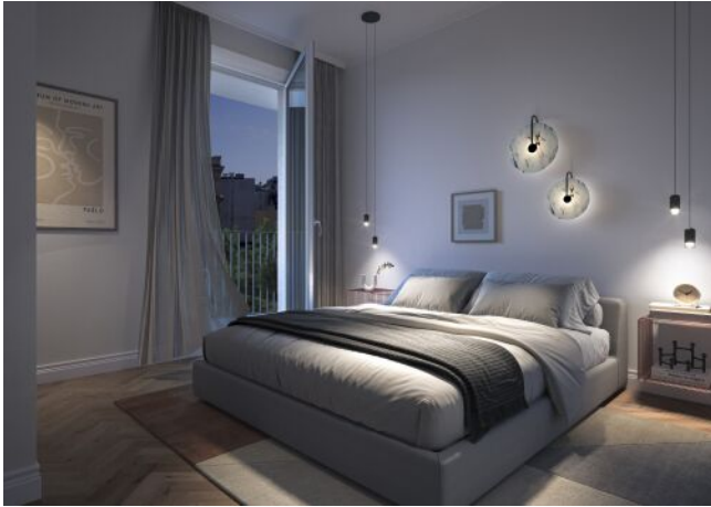
Vivienne | Schlafzimmer