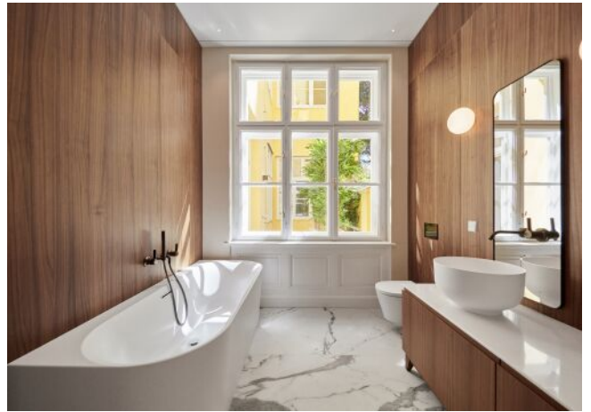
Wattmanngasse 25 | Badezimmer