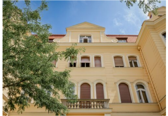
Wattmannngasse 25 | Fassade