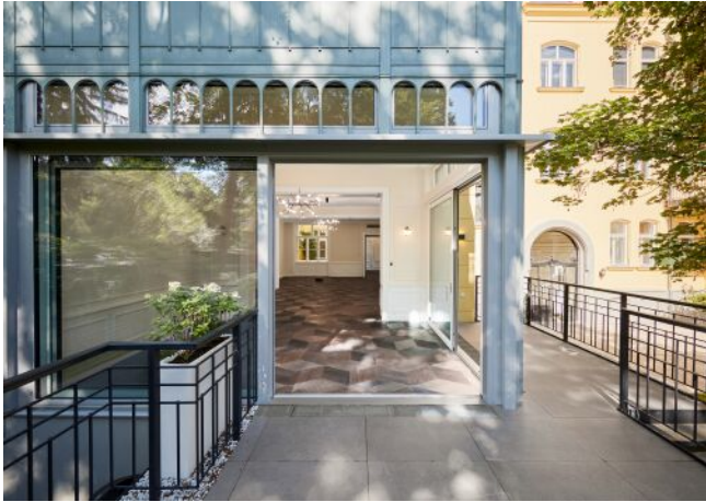
Wattmanngasse 25 | Wohnraum