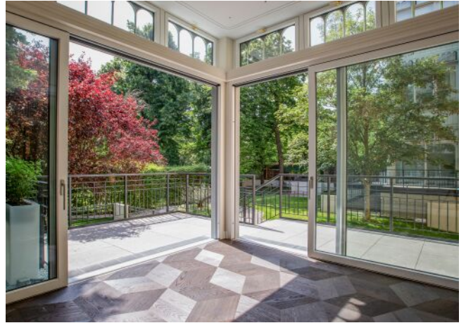
Wattmanngasse 25 | Terrasse