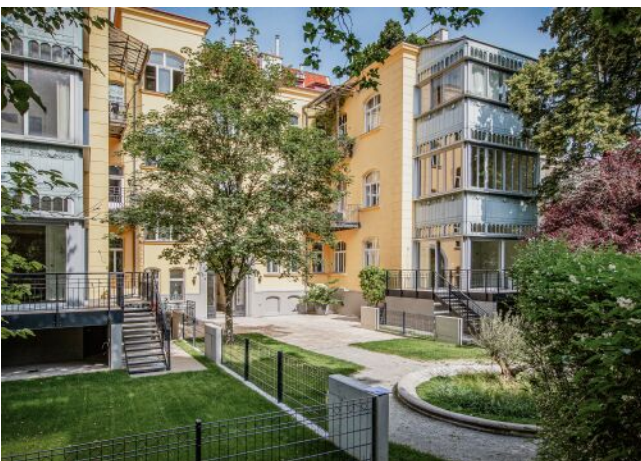
Wattmannngasse 25 | Garten