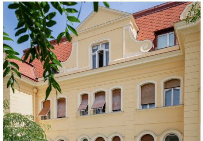
Wattmannngasse 25 | Fassade