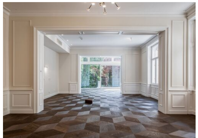
Wattmannngasse 25 | Wohnraum