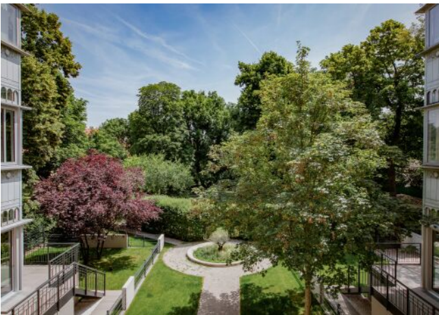
Wattmannngasse 25 | Gartenparadies