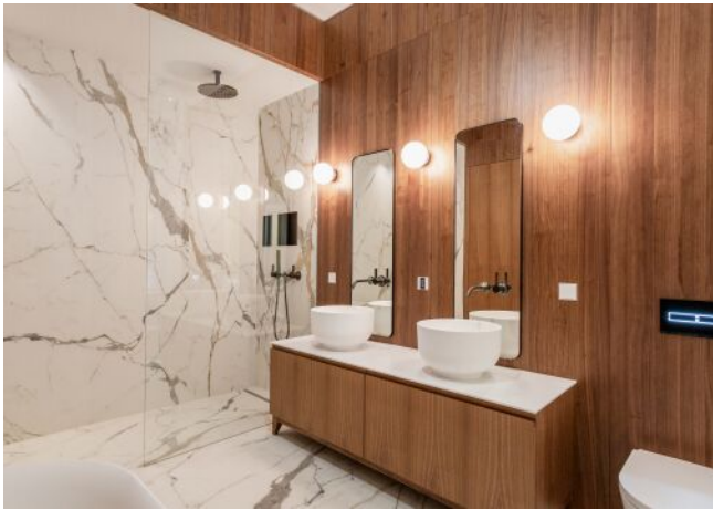
Wattmanngasse 25 | Badezimmer