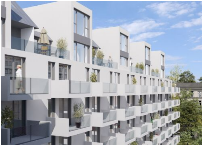
Am Spitz 5 | Hof