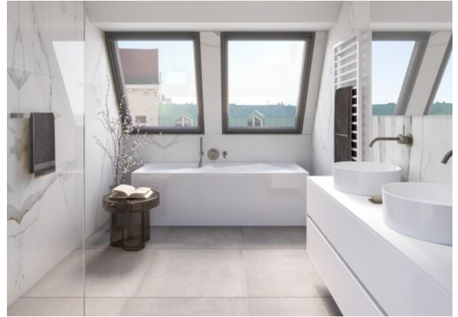
Essenz No. 1 | Bad Dachgeschoss