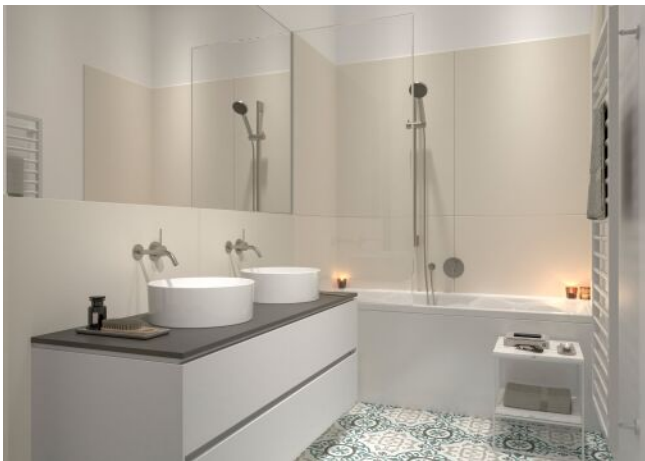
Essenz No. 1 | Badezimmer Regelgeschoss