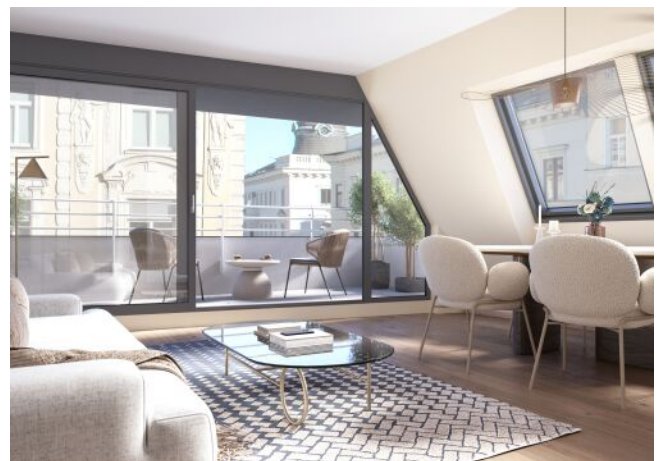
Essenz No. 1 | Wohnraum Dachgeschoss