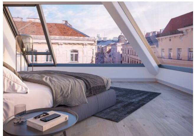
Essenz No. 1 | Schlafzimmer Dachgeschoss