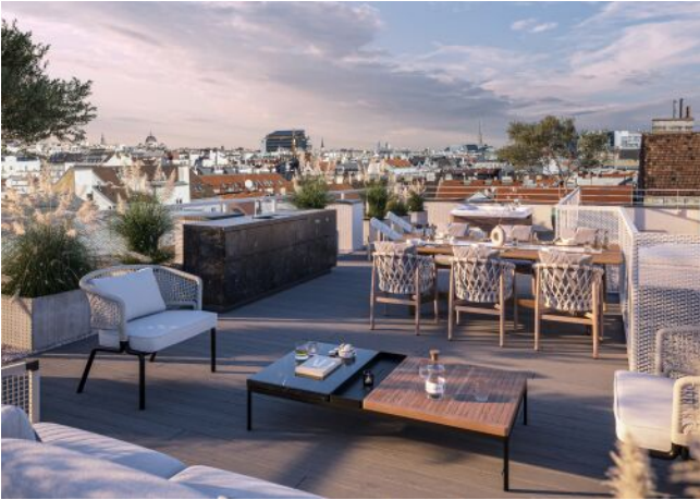
Essenz No. 1 | Dachterrasse