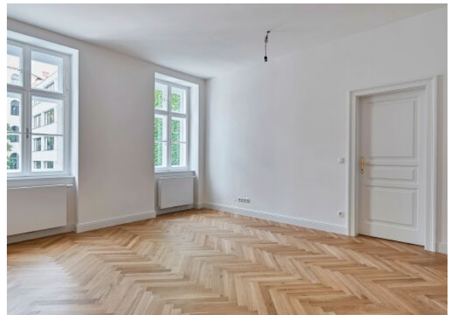
Esterhazygasse 28 | Wohnung