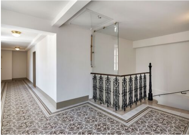
Esterhazygasse 28 | Stiegenhaus