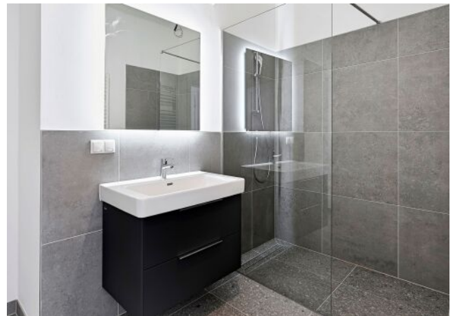
Esterhazygasse 28 | Badezimmer