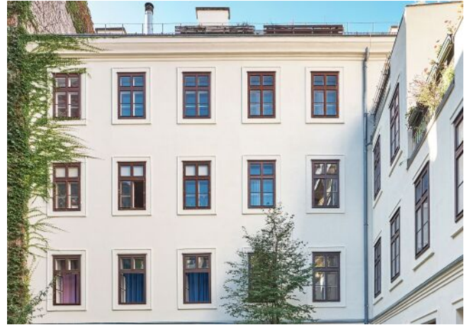
Esterhazygasse 28 | Hof