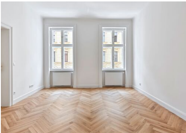
Esterhazygasse 28 | Wohnung