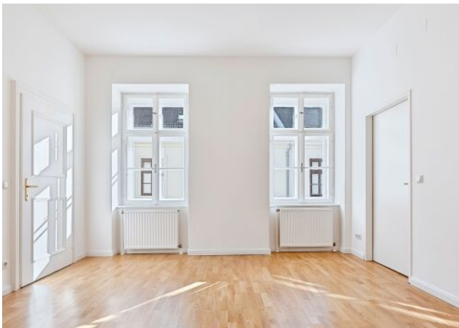
Esterhazygasse 28 | Wohnung