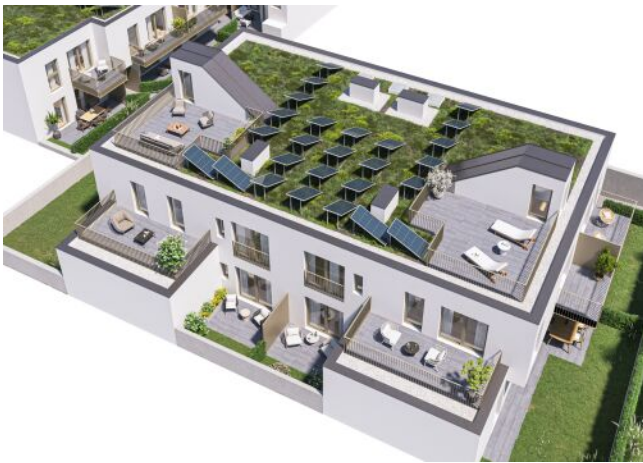
Ottakringer Straße 26 | Townhouses