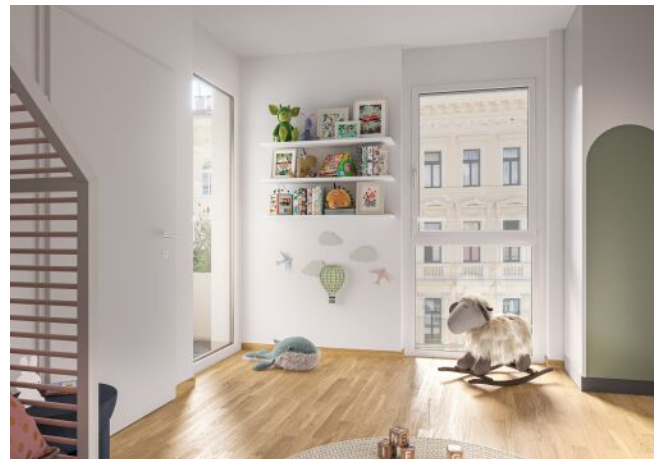
Ottakringer Straße 26 | Kinderzimmer