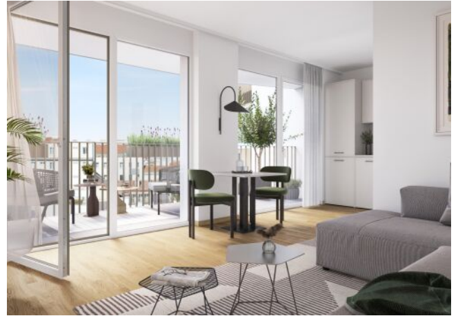
Ottakringer Straße 26 | Wohnraum