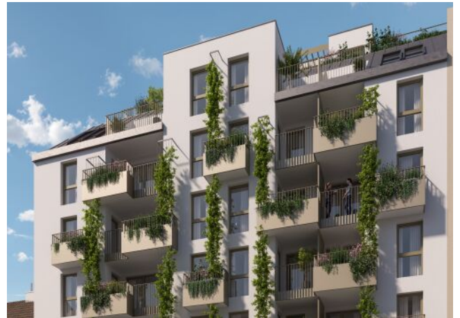
Ottakringer Straße 26 | Fassade Tag