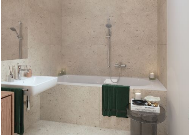
Ottakringer Straße 26 | Badezimmer