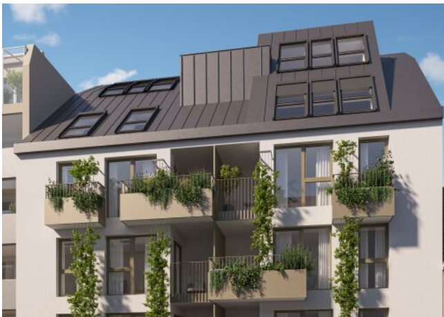
Ottakringer Straße 26 | Fassade Veronikagasse