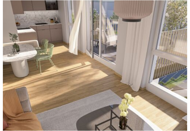
Ottakringer Straße 26 | Wohnraum