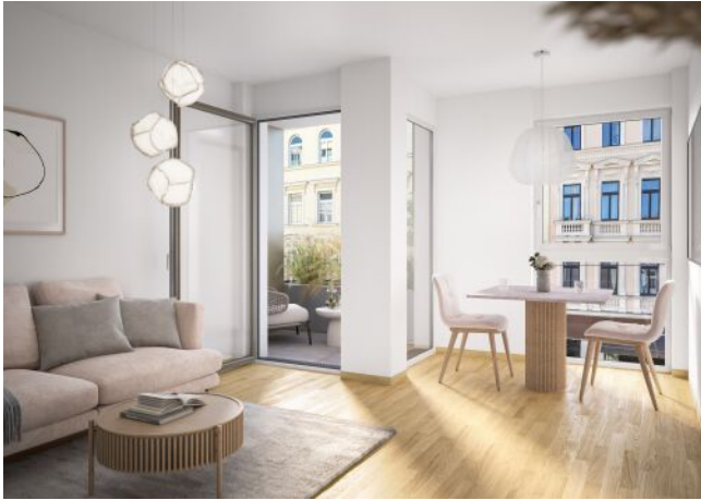
Ottakringer Straße 26 | Wohnraum