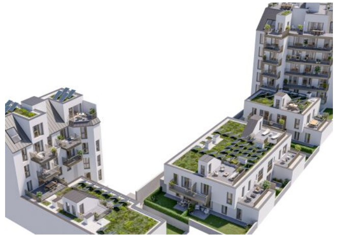
Ottakringer Straße 26 | Vogelperspektive