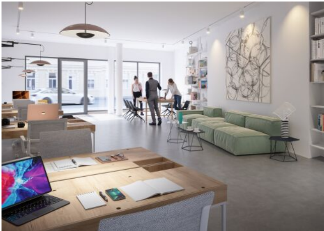
Ottakringer Straße 26 | Geschäftsfläche