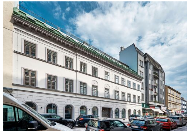
The Fusion | Fassade