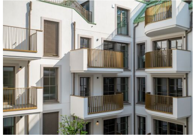
The Fusion | Innenhof