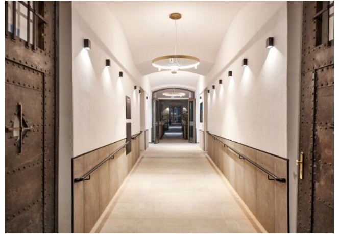
The Fusion | Eingang