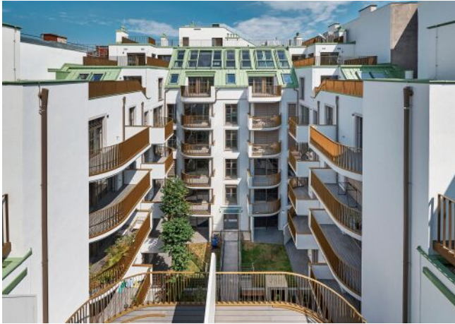
The Fusion | Innenhof