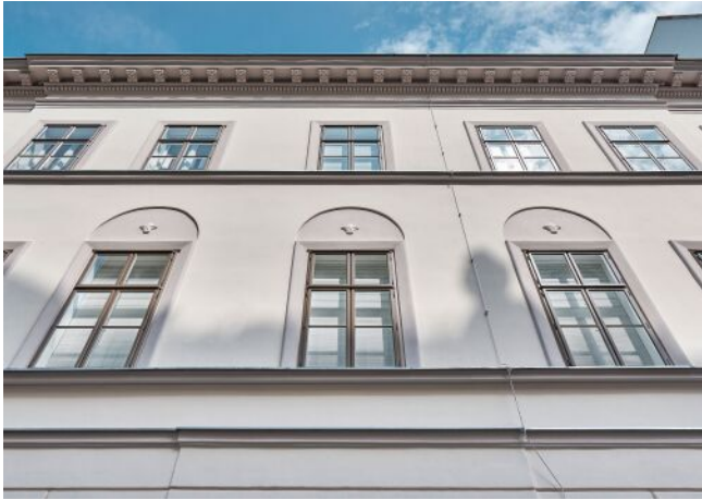
The Fusion | Fassade