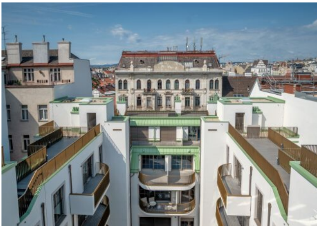
The Fusion | Innenhof