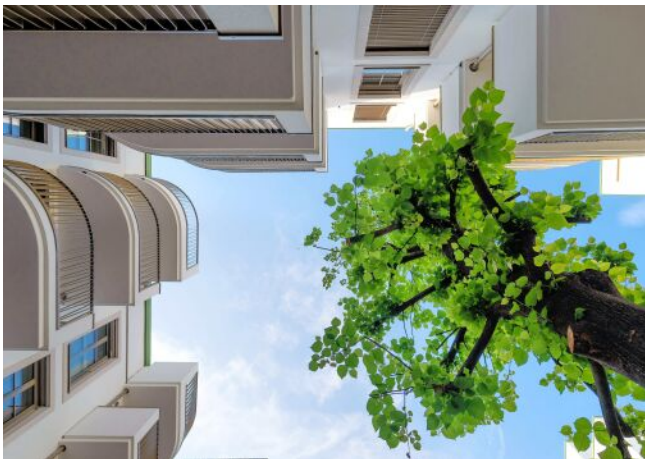
The Fusion | Innenhof