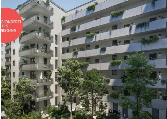
TRAISENGASSE | Innenhof-Ruheoase