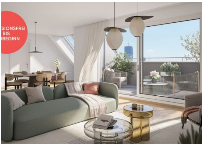
TRAISENGASSE | Wohnzimmer mit Donaublick