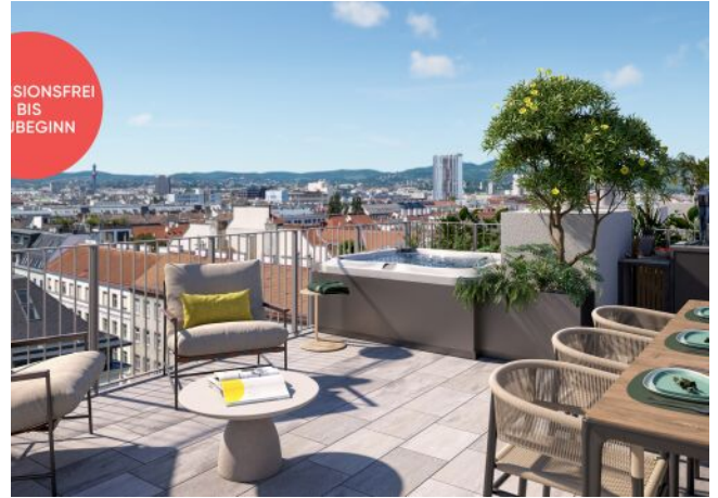
TRAISENGASSE | Dachterrasse mit Stadtblick