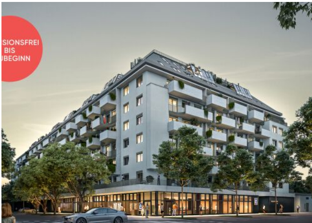
TRAISENGASSE | Nachtansicht