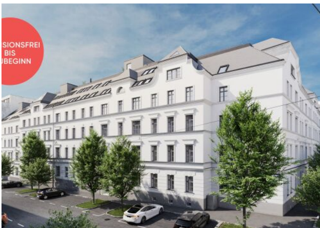
Rosegggasse | Fassade Tag