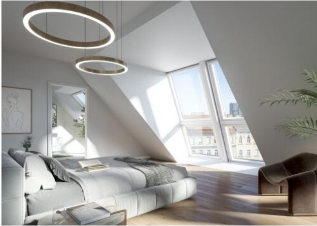
The Legacy | Schlafzimmer Dachgeschoss