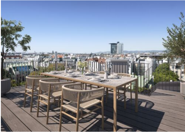
The Legacy | Dachterrasse