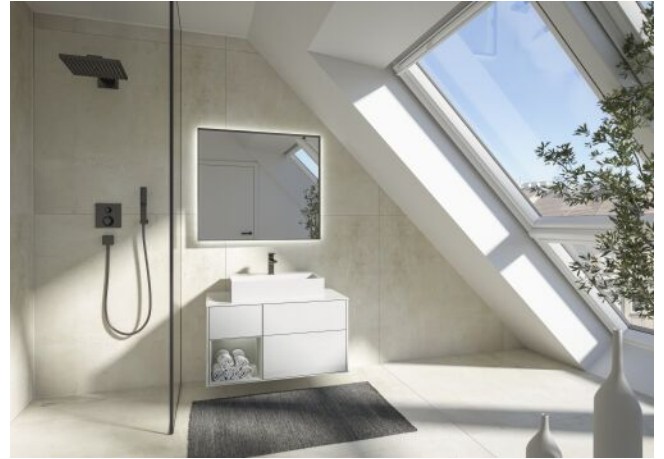
The Legacy | Badezimmer Dachgeschoss