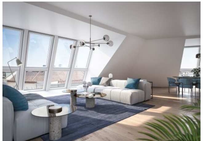
The Legacy | Wohnraum Dachgeschoss