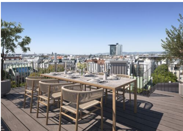
The Legacy | Dachterrasse