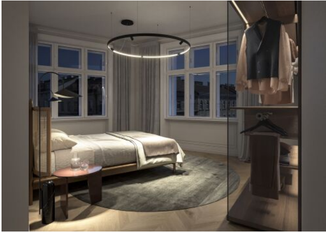
The Legacy | Schlafzimmer Regelgeschoss