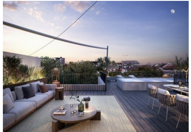
The Legacy | Dachterrasse