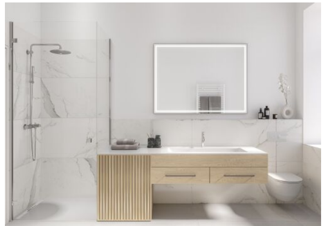
The Legacy | Badezimmer Regelgeschoss