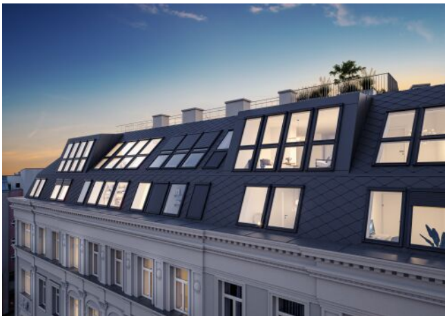
The Legacy | Dachgeschoss