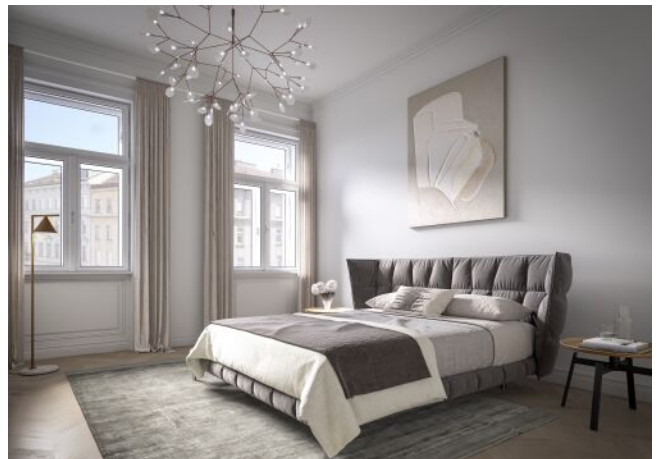
The Legacy | Schlafzimmer Regelgeschoss