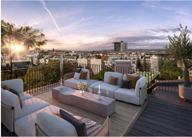
The Legacy | Dachterrasse