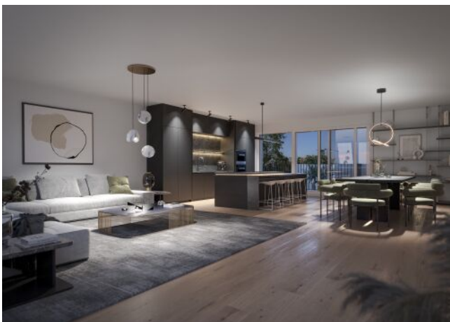
The Legacy | Wohnraum Dachgeschoss