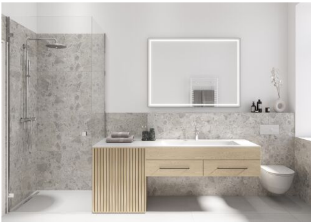
The Legacy | Badezimmer Regelgeschoss