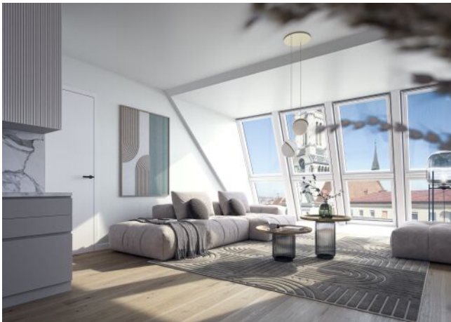
The Legacy | Wohnraum Dachgeschoss