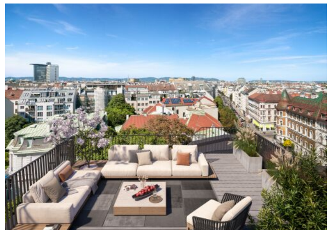
The Legacy | Dachterrasse