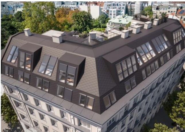
The Legacy | Fassade