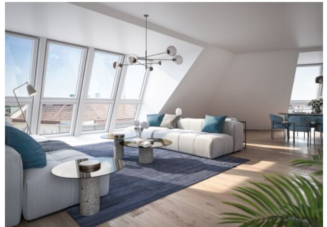
The Legacy | Wohnraum Dachgeschoss