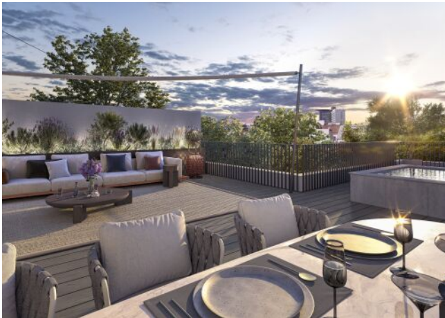
The Legacy | Dachterrasse