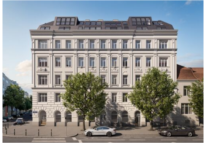
The Legacy | Fassade