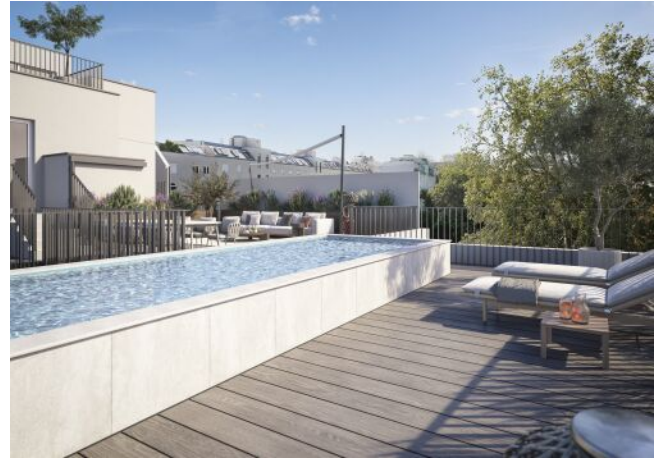
The Legacy | Dachterrasse Pool