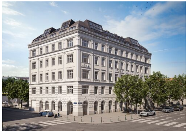
The Legacy | Fassade