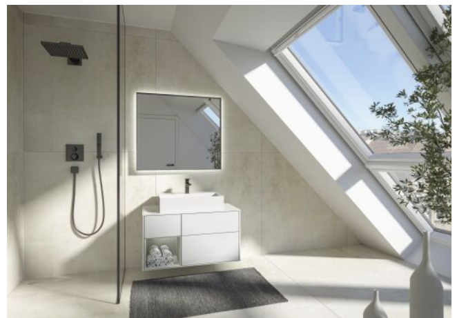
The Legacy | Badezimmer Dachgeschoss