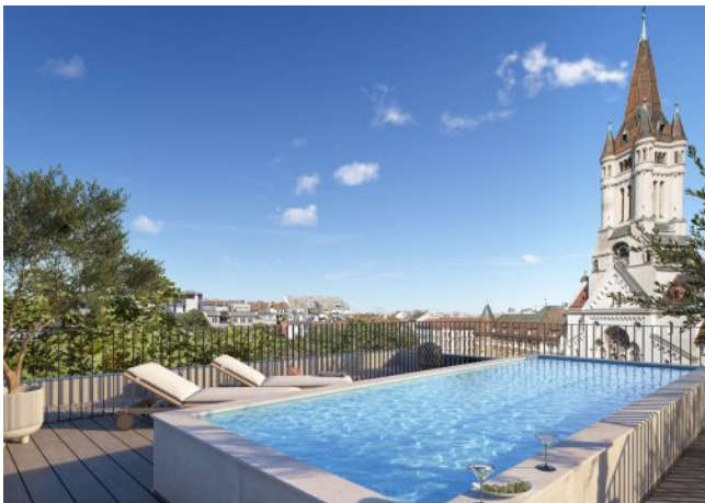
The Legacy | Dachterrasse Pool