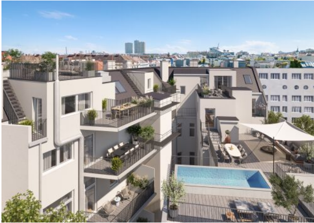
The Legacy | Hof