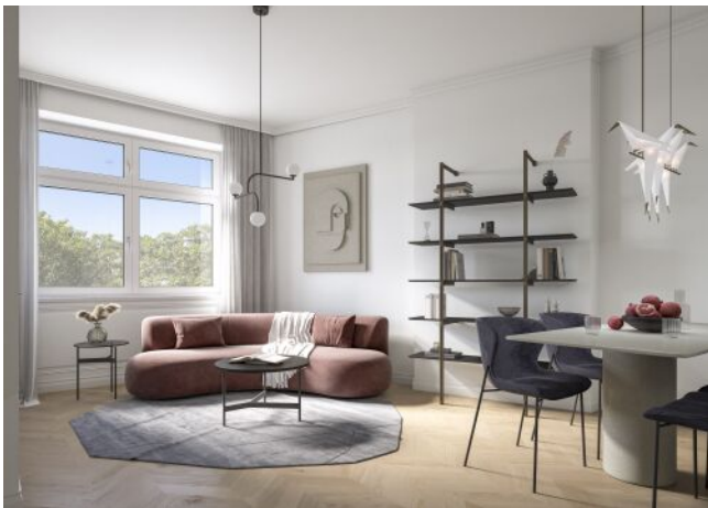
The Legacy | Wohnraum Regelgeschoss