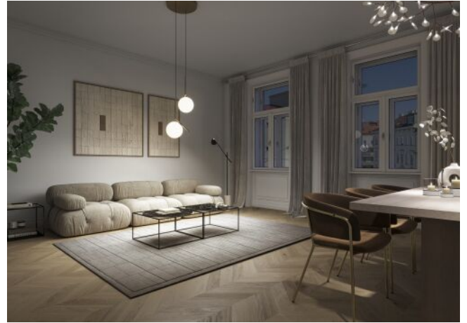
The Legacy | Wohnraum Regelgeschoss