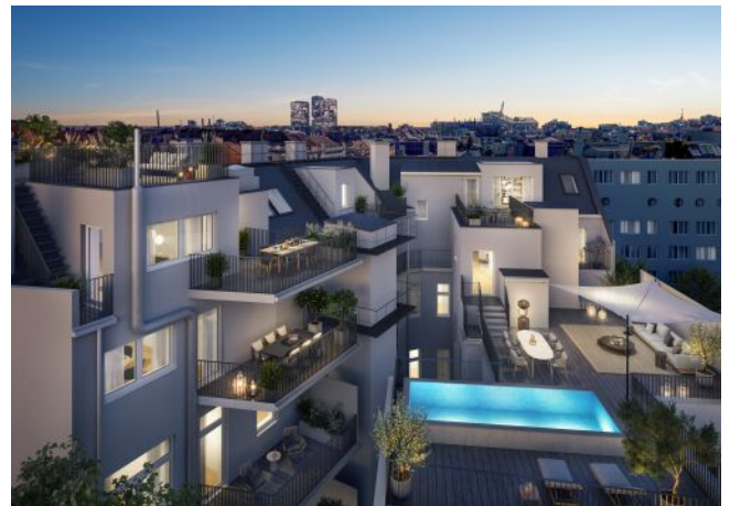
The Legacy | Hof