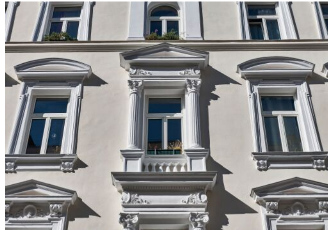
Leibenfrostgasse 8 | Fassade Detail