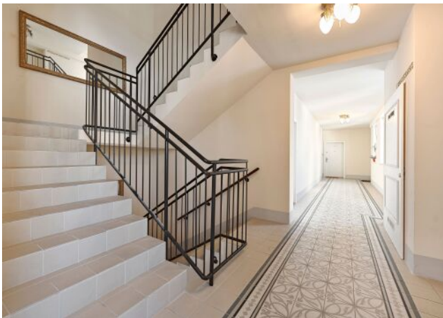
Leibnizgasse 8 | Stiegenhaus