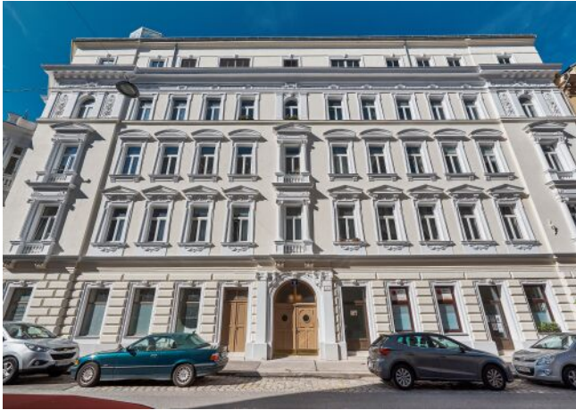
Leibenfrostgasse 8 | Fassade