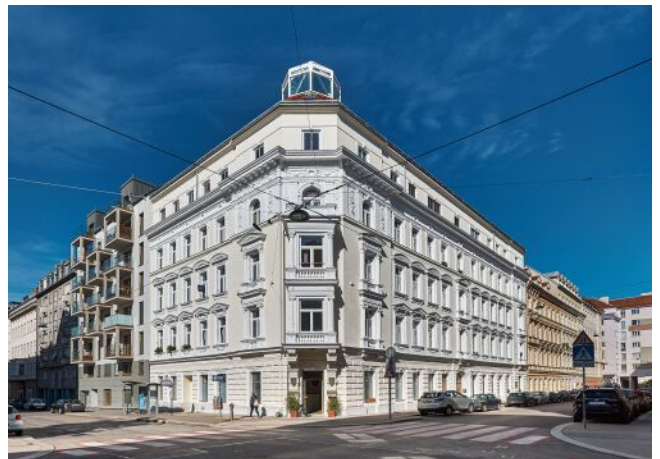
Leibnizgasse 8 | Fassade