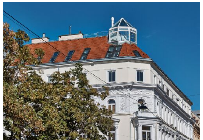
Leibenfrostgasse 8 | Fassade