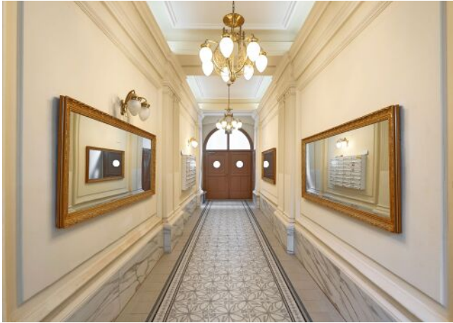
Leibnizgasse 8 | Hauseingang