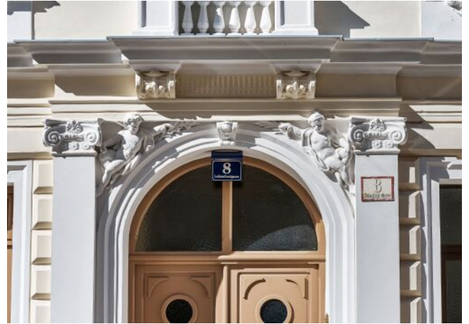
Leibenfrostgasse 8 | Fassade Detail