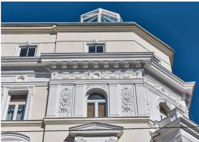
Leibenfrostgasse 8 | Fassade Detail