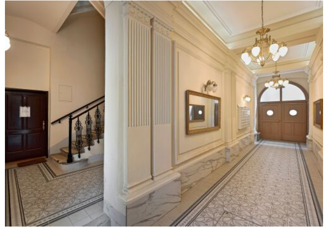
Leibnizgasse 8 | Hauseingang