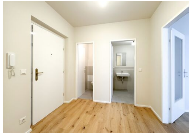
Schäffergasse 18-20 | Top 30