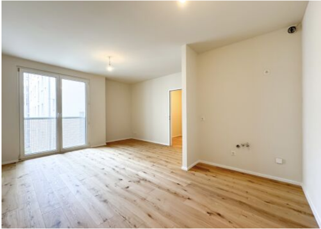
Schäffergasse 18-20 | Top 30