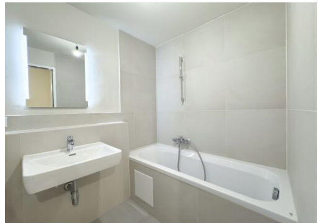
Schäffergasse 18-20 | Top 30