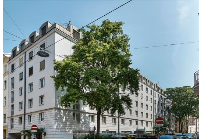
Schäffergasse 18-20 | Fassade