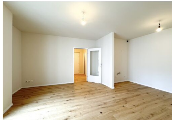
Schäffergasse 18-20 | Top 30