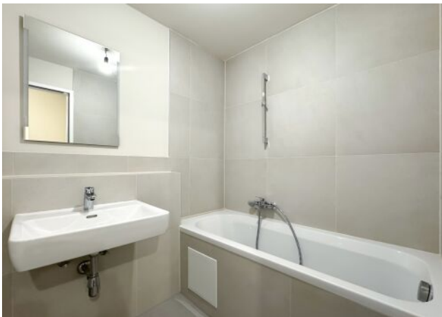
Schäffergasse 18-20 | Top 30