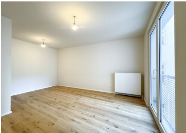
Schäffergasse 18-20 | Top 30