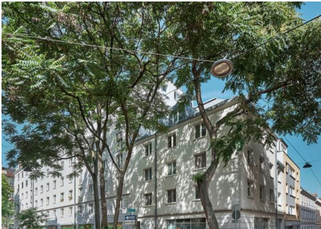
Schäffergasse 18-20 | Fassade