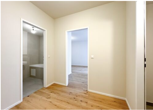
Schäffergasse 18-20 | Top 30